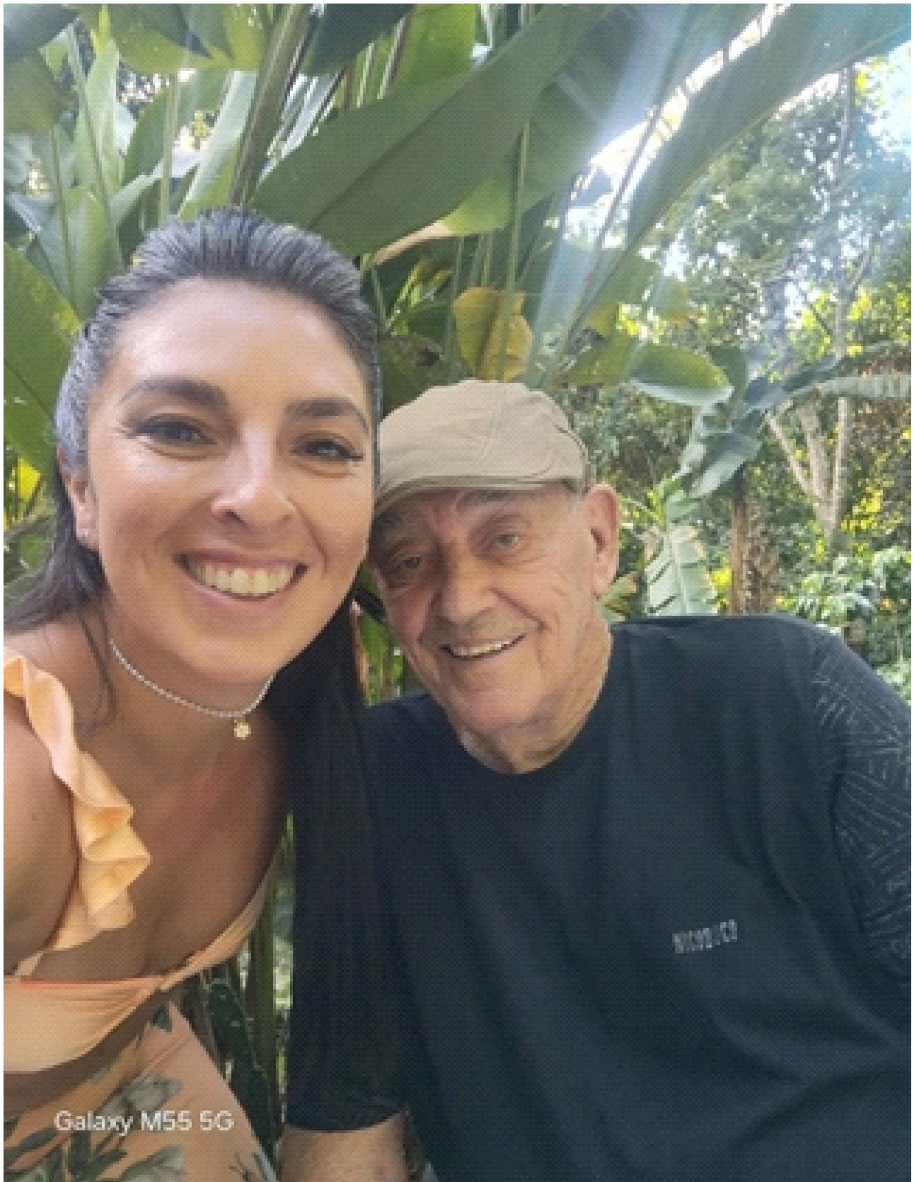
A amizade não limita a idade