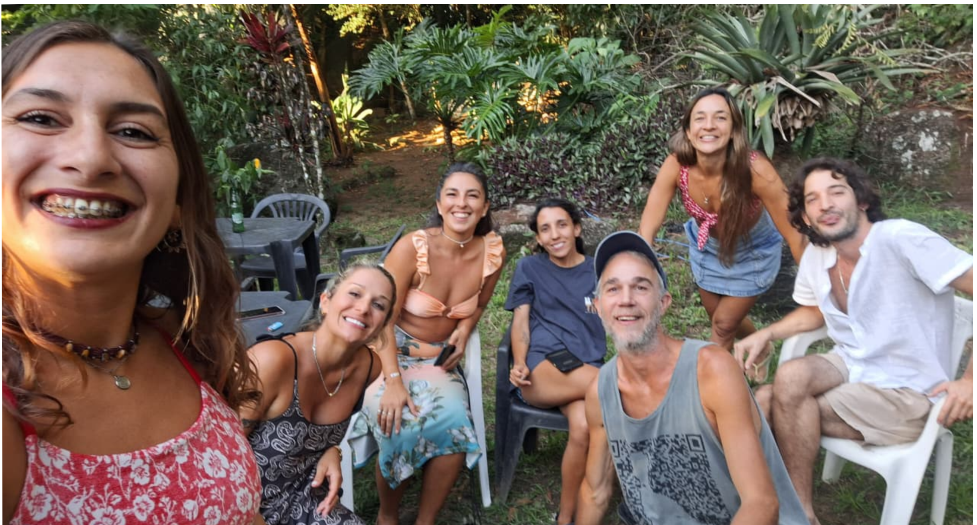
É prazeroso estar entre amigos e o celular só para self