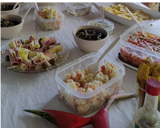
O sabor dos acepipes desfiava a gula