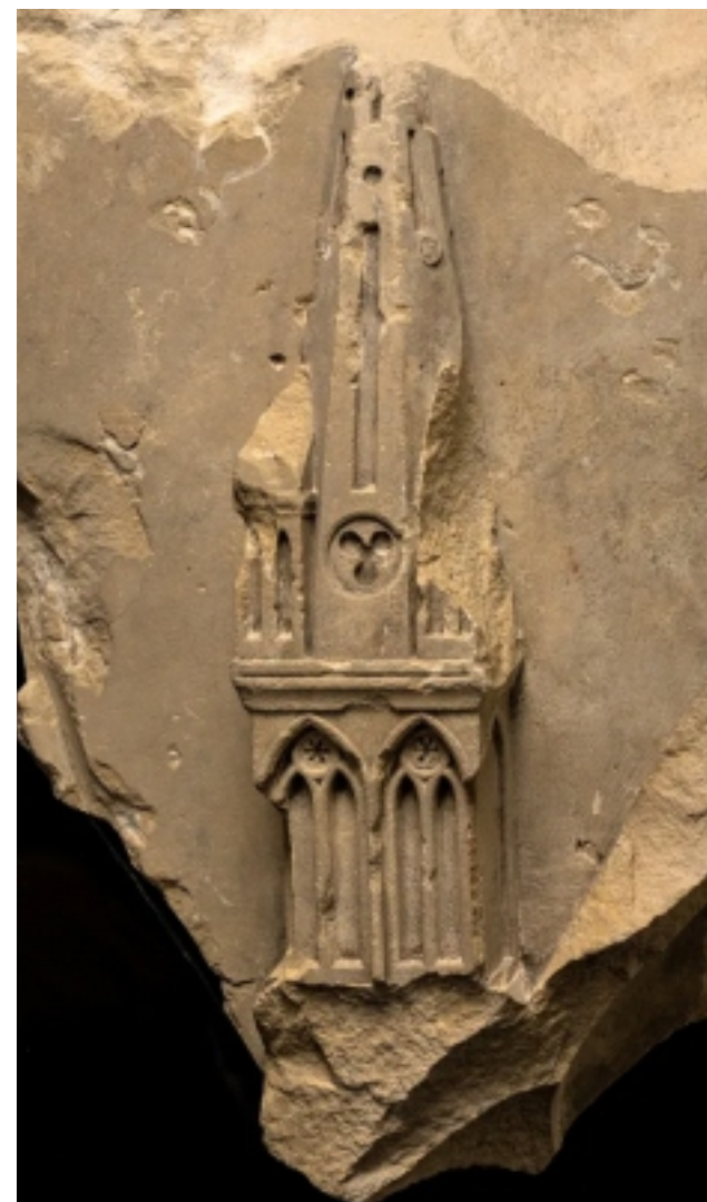
Uma peça de decoração esculpida encontrada durante as escavações.

O biombo de calcário era uma obra-prima da escultura gótica pintada. Entre as figuras em tamanho real que a equipe de Besnier escavou estavam a cabeça e o tronco de um Cristo sem vida – olhos fechados, sangue vermelho escorrendo do ferimento de lança em seu lado . “A