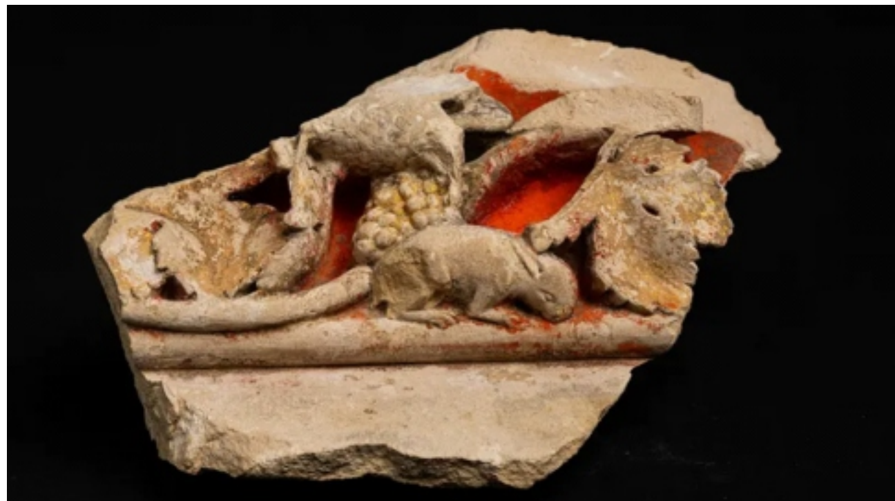
Acredita-se que, originalmente, todas as esculturas de Notre Dame eram pintadas com cores vivas. Aqui, alguns resquícios de pigmento vermelho sobrevivem em uma escultura recuperada.