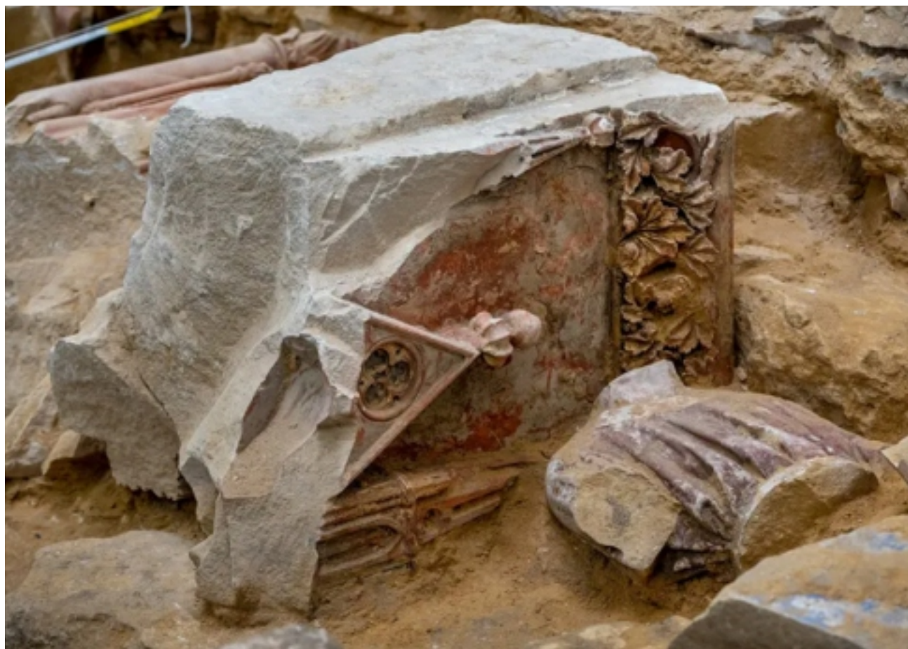
O biombo do século 13 foi destruído no início do século 18. Partes dele foram enterradas sob a catedral.

Besnier não sabe ao certo quanto do biombo sua equipe escavou, mas acredita que muito mais está enterrado sob o coro, fora do escopo da escavação. “Seria